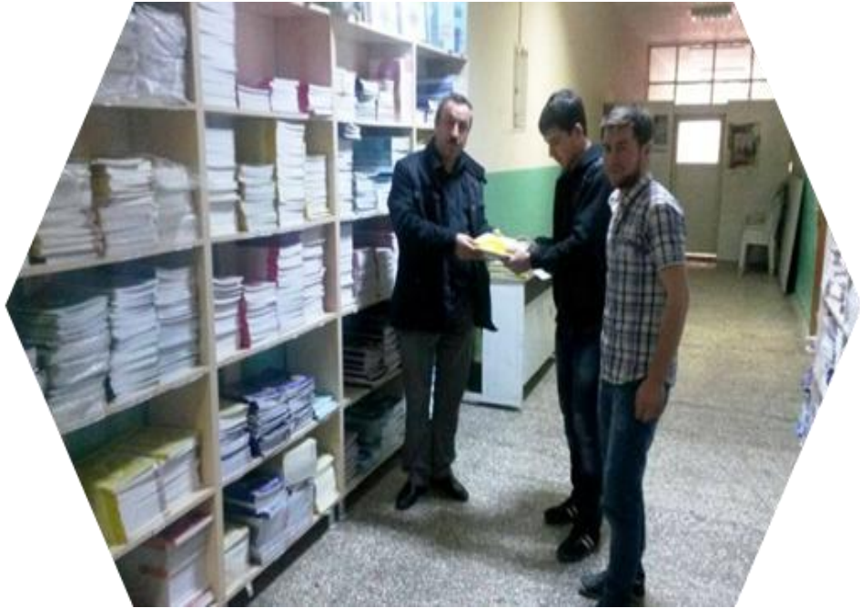
AÇIK ÖĞRETİM İŞLERİ