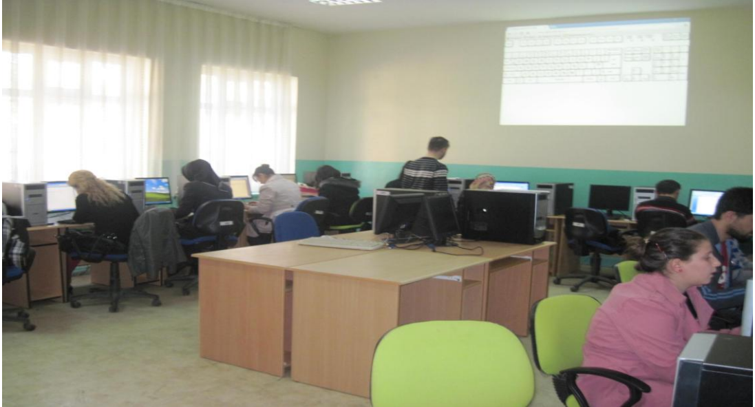
BİLGİSAYAR KULLANIMI KURSU

Ayrıca Bakanlığımızca yapılan son değişikliklerle Açık Öğretim Okullarının tüm iş ve işlemleri Merkezimize devredilmiştir. Bu işlemler yetkili ve deneyimli idarecilerimiz ve personellerimiz aracılığı ile yürütülmektedir. Merkezimiz bünyesinde açık öğretim bürosu açılmış ve bu büroda her türlü danışmanlık hizmeti verilmektedir.